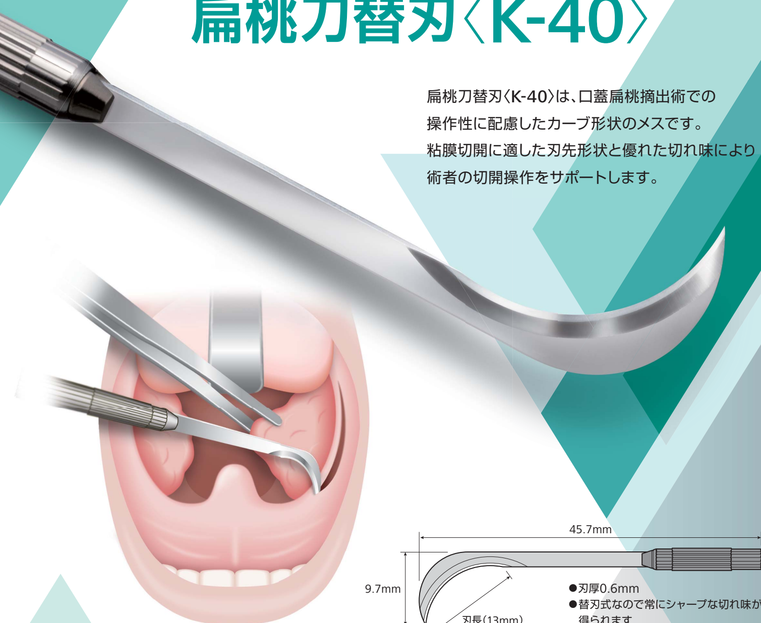
※イラストはイメージ図です。

扁桃刀替刃〈K-40〉は、口蓋扁桃摘出術での操作性に配慮したカーブ形状のメスです。粘膜切開に適した刃先形状と優れた切れ味により術者の切開操作をサポートします。