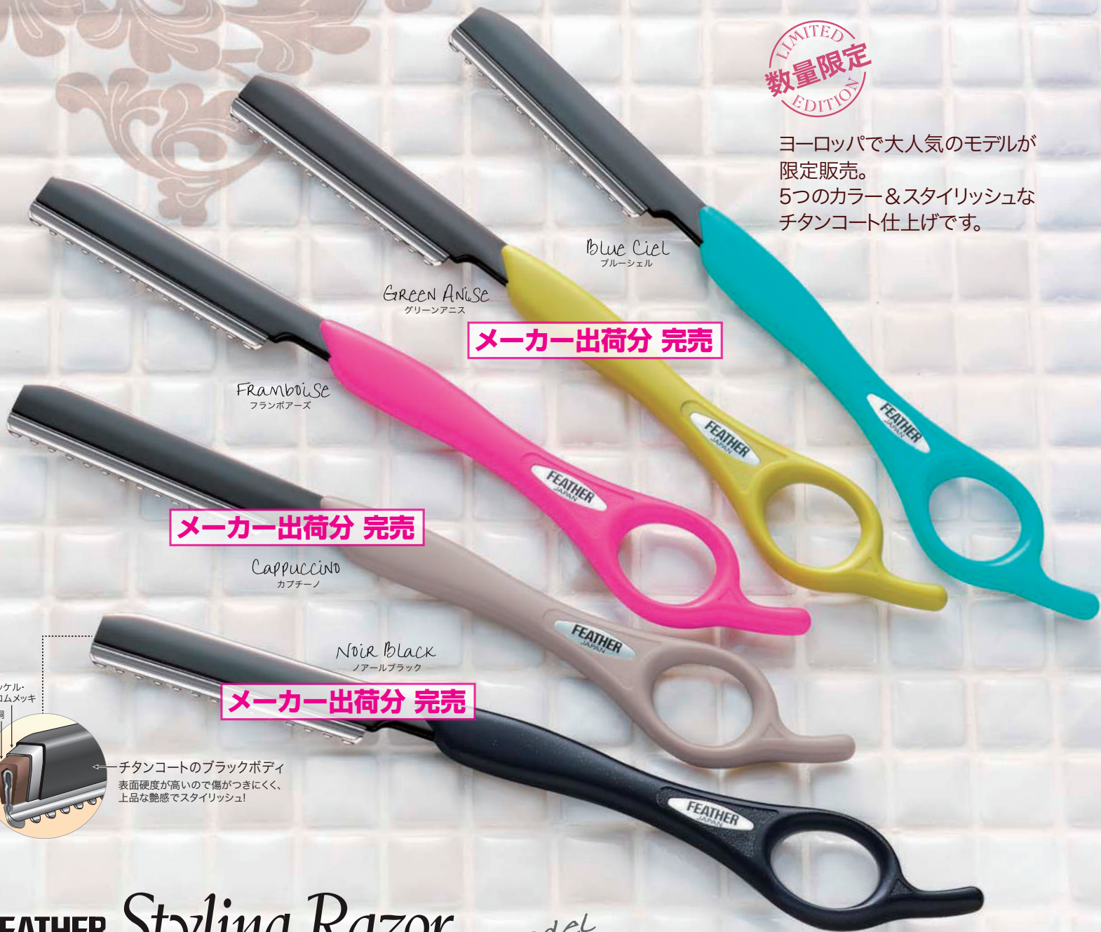
Blue Ciel ブルーシエル

ヨーロッパで大人気のモデルが 限定販売。 5つのカラー&スタイリッシュな チタンコート仕上げです。