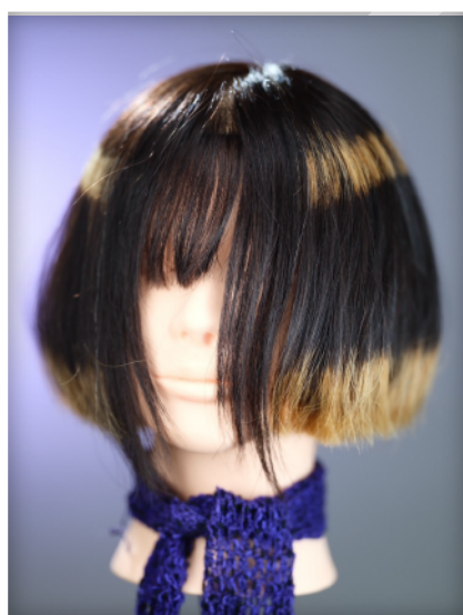
大島 萌乃香 様 名古屋モード学園