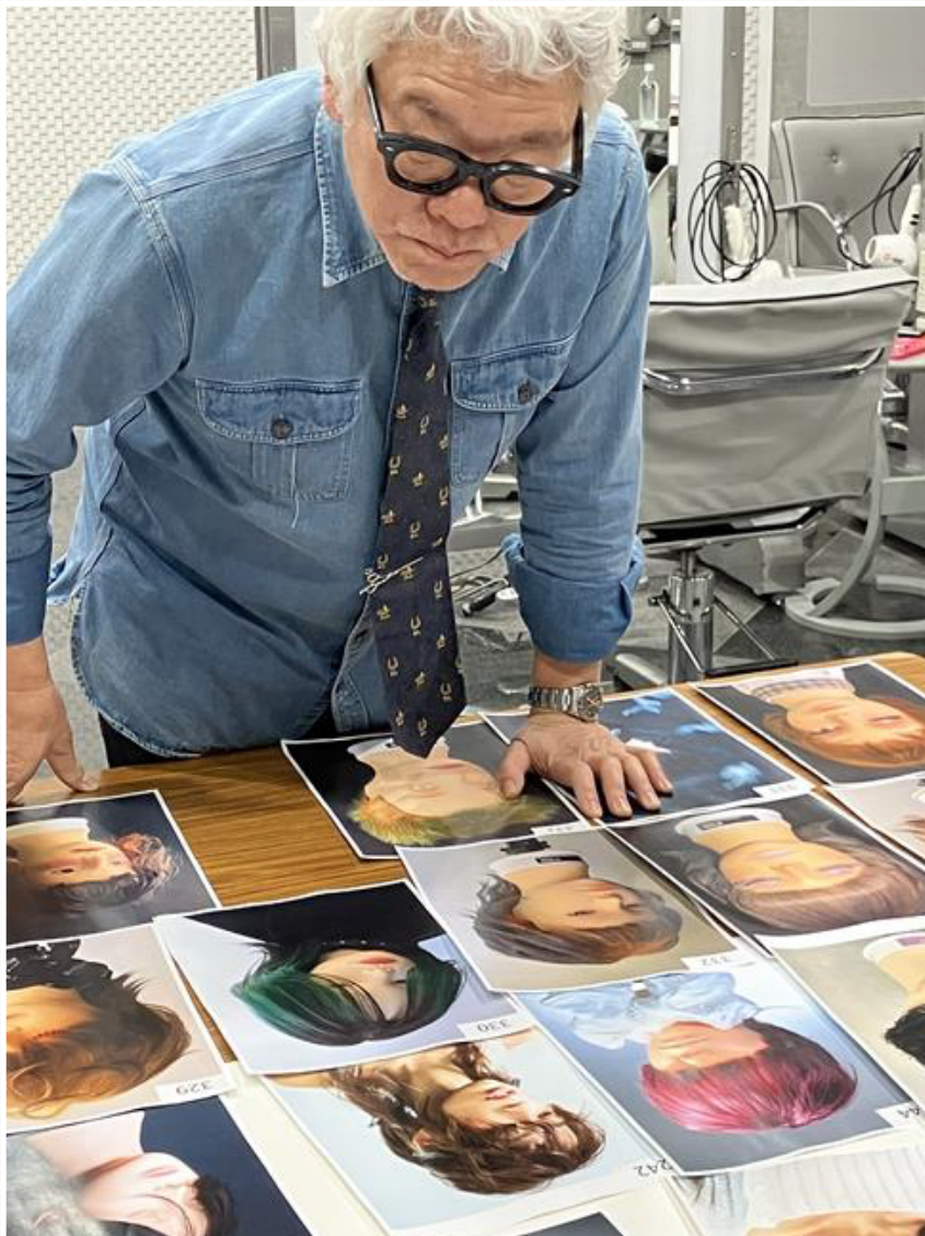
入賞作品の選出は山下氏のサロン (Double SONS) で実施されました