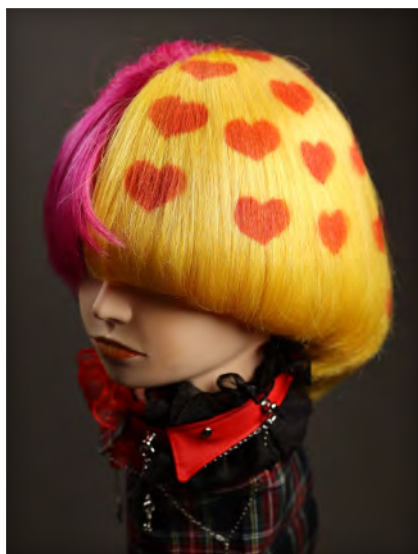
佐原 宙奈 様 名古屋モード学園