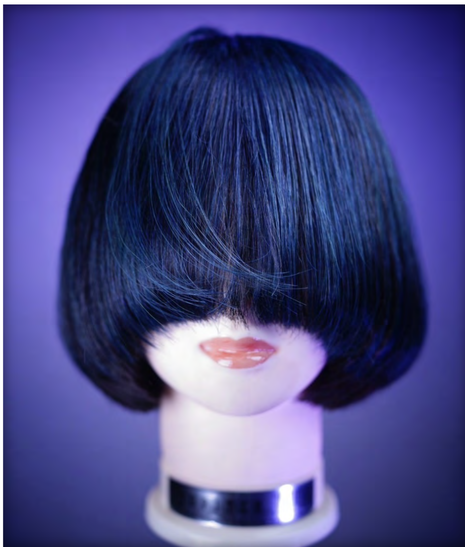
村瀬 可帆 様