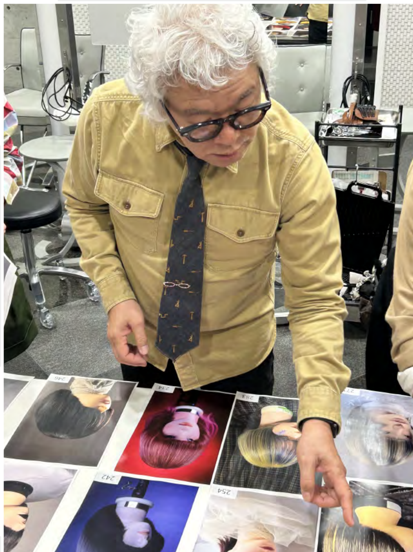
入賞作品の選出は山下氏のサロン (Double SONS) で実施されました