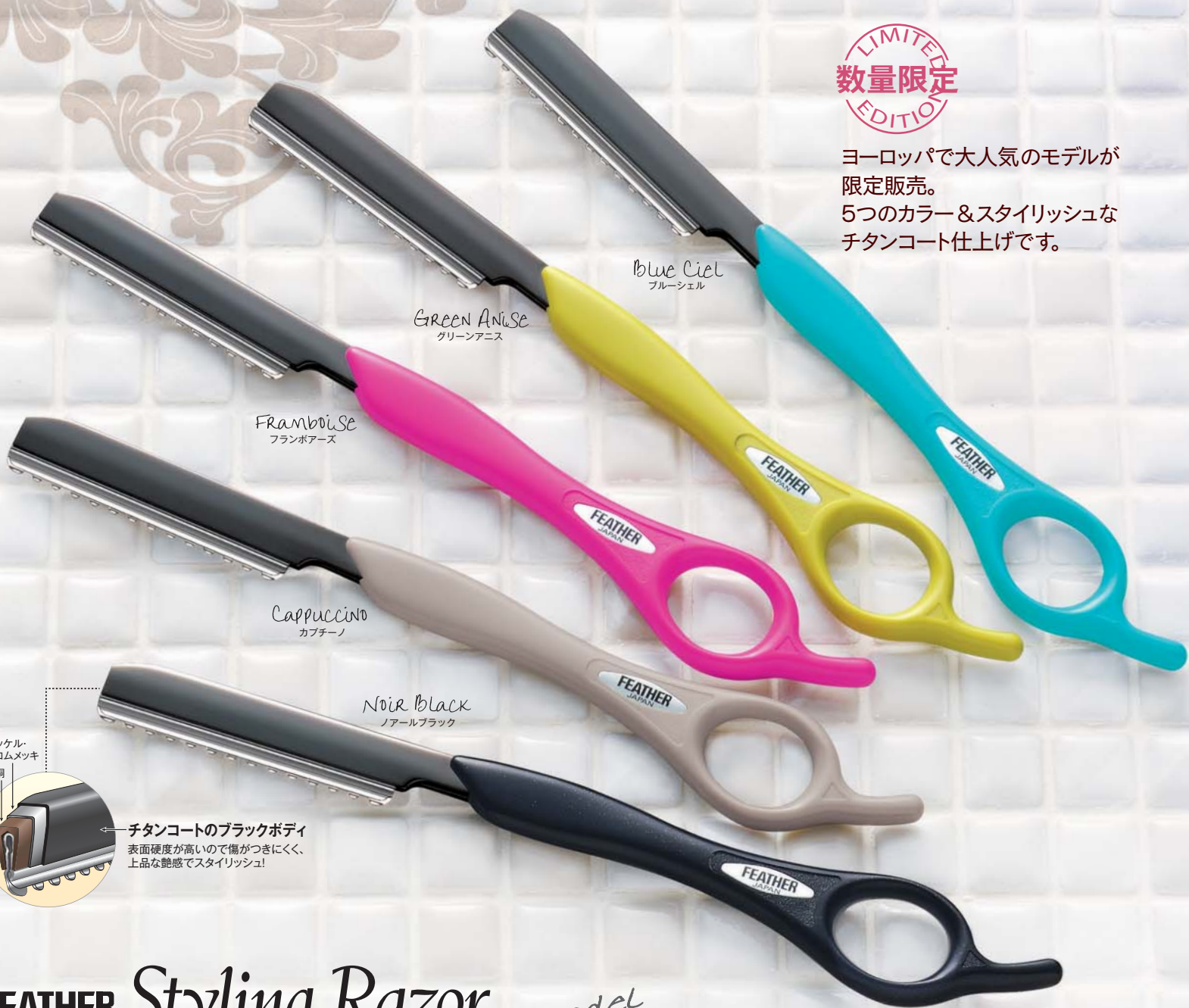
Blue Ciel ブルーシエル

ヨーロッパで大人気のモデルが 限定販売。 5つのカラー&スタイリッシュな チタンコート仕上げです。