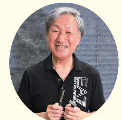
監修: 矢田 正明 (全理連中央講師会 名誉講師)

優れた保湿力で肌にハリを与えます。 ナイティブエッセンス配合(コエンザイムQ10含有) 弱酸性、無着色・無香料