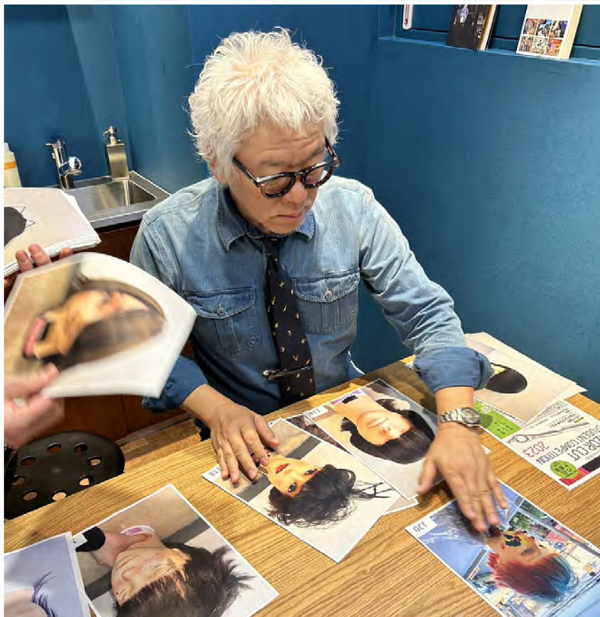
入賞作品の選出は山下氏のサロン (Double SONS) で実施されました