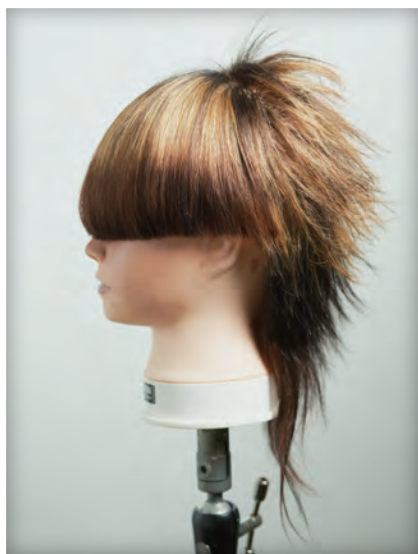
谷野 沙瑛 様 大阪モード学園